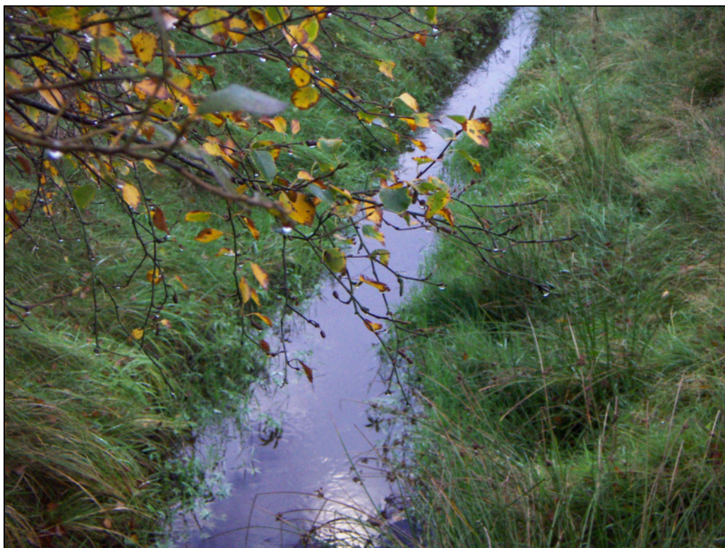
Figur 1.1 Hejbøl bæk

Toiletvand fra området bortledes via et vakuumsystem til Nr. Nebel Renseanlæg. Det grå spildevand fra f.eks. køkkenvaske nedsives. Afvandingsystemet sikrer, at grundvandet holdes passende lavt, så nedsivningsanlæggene for det "grå" spildevand kan fungere.