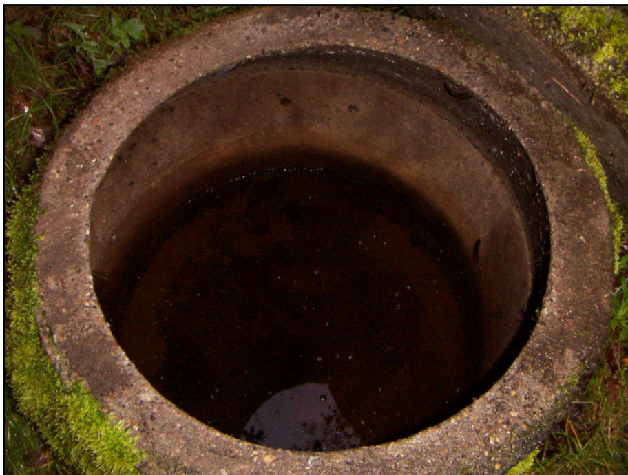
Figur 2.1 Eksempel på brønd med vandfyldning over ledningerne

Observationerne er vist på tegning 1. Her ses, at brønd tilstand, vandfyldning og afstrømning generelt er dårligst i Sdr. Skovvej og Jens Thomsensvej vest for V. Hennebysvej.